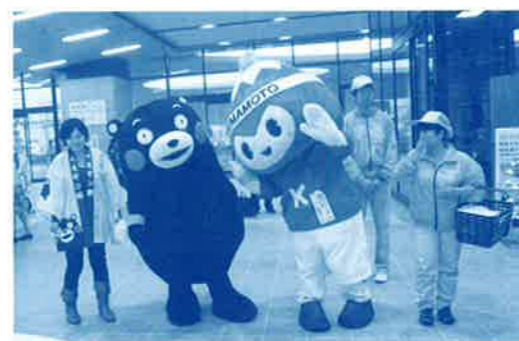
熊本駅では多くのお出迎えがありました

現在、高知大会のPRのため、広報キャラバ ン隊が県内各地を回っていますので、「くろし おくん」を見つけたら、ぜひ応援の声をお掛け ください!