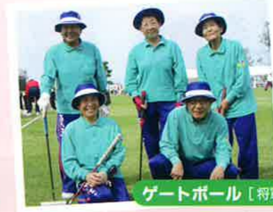
ゲートボール [将軍]