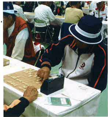
競技が始まると、会場は一転して静寂に。長らく考え込む姿も見られた

の世話役を引き受けるようになってから、試合に出場するよりも裏方の仕事の方が多くなったそうだ。今大会の参加は、ねんりんピック高知2013の視察も兼ねているとか。「再来年は最強チームで挑みます。お楽しみに」とほほ笑んだ。