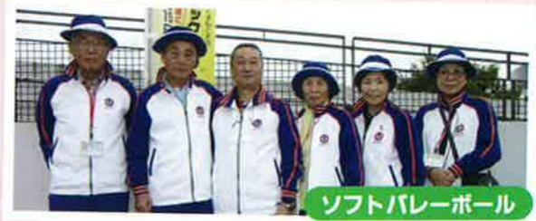
ソフトバレーボール