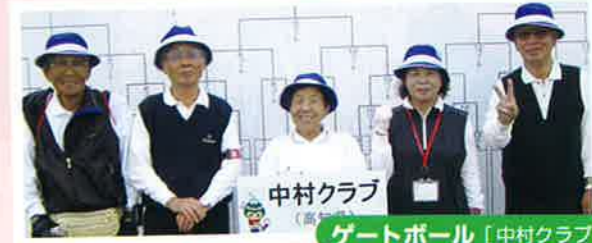
ゲートボール [中村クラブ]