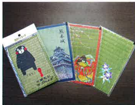
(柄が写真と異なる場合がありますので、ご了承ください)

ねんりんピック熊本2011に、私も行ってきました!ねんりんピックには今回初めて参加させていただきましたが、全国から集まった大勢の選手団と、総合開会式の盛大さに驚きました。また、スポーツだけではなく、囲碁や将棋など、様々な種目があることを初めて知りました。真剣に取り組む選手の方々を見て、感動して帰ってきました。選手の皆さんが生き生きと楽しそうに汗を流す姿に、自分が年を重ねてもこんなふうでありたいな、と思いました。2013年には、高知県でもねんりんピックが開催されます。その時には、シニアの皆さんの競技に挑む素晴らしい姿が高知でも見られると思うと、楽しみでなりません。(岡田)