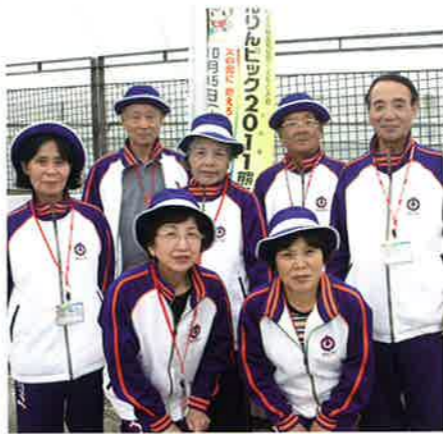
冗談を言い合う仲の良い高知県代表メンバー。

インに行っていて、「個人の良さを見極め、その部分を伸ばすことが目標」。教えた仲間たちが、試合で頑張っている姿を見ると、「とてもうれしい」と笑顔をこぼした。