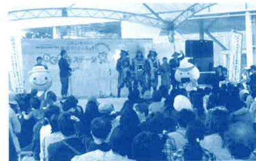
来年度開催の宮城県PRステージに「くろしおくん」も出演

交流大会では、本県の選手も日頃の練習の 成果を発揮し、マラソンをはじめ、いくつかの 種目で入賞されるなど大健闘。また、地元老 人クラブの方や学生ボランティアが活躍した イベント会場では、健康フェア、地域文化伝承