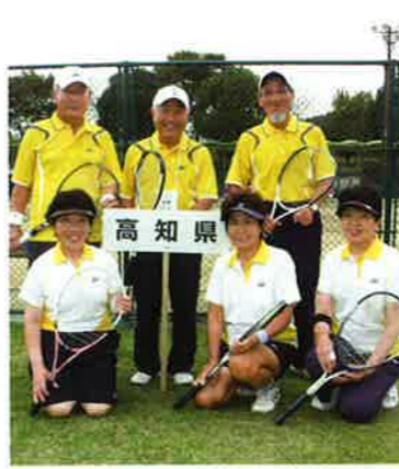
四万十町から安芸市までの選手が集まり、団体戦に挑んだ高知県代表

「パートナーとのコンビネーションや対戦相手との駆け引きが必要なので、ソフトテニスには面白いです。体と頭、両方使いますから」と笑う。ねんりんピックでは、県外の選手はもちろん、一緒にチームを組む県内の選手との交流も楽しいそうだ。