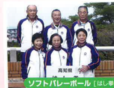
高知県 ソフトバレーボール [はし拳]

〒781-1801 吾川郡仁淀川町森 4231 TEL 0889-32-1041