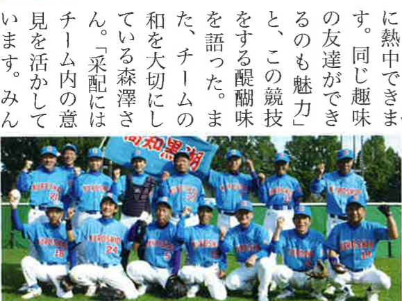
チームワークと仲の良さが感じられた高知黒潮シニア