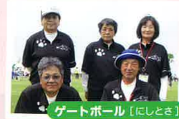
ゲートボール [にしとさ]