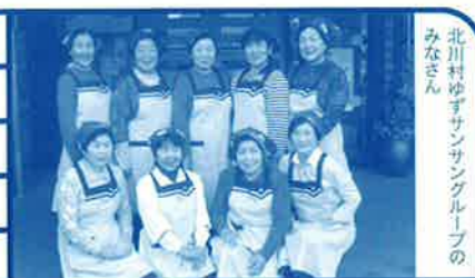
北川村ゆずサンサングループのみなさん