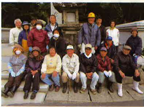
足摺岬を愛する仲間たちとの毎月20日の美化活動。和気あいあいの一コマです

退職後、35年間住み慣れた関西から故郷の足摺岬に帰られ、畑仕事や洋蘭などを育ててのんびり暮ら