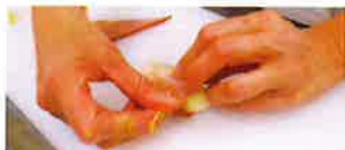
ベーコンを斜め切りして長さを保つと巻きやすい