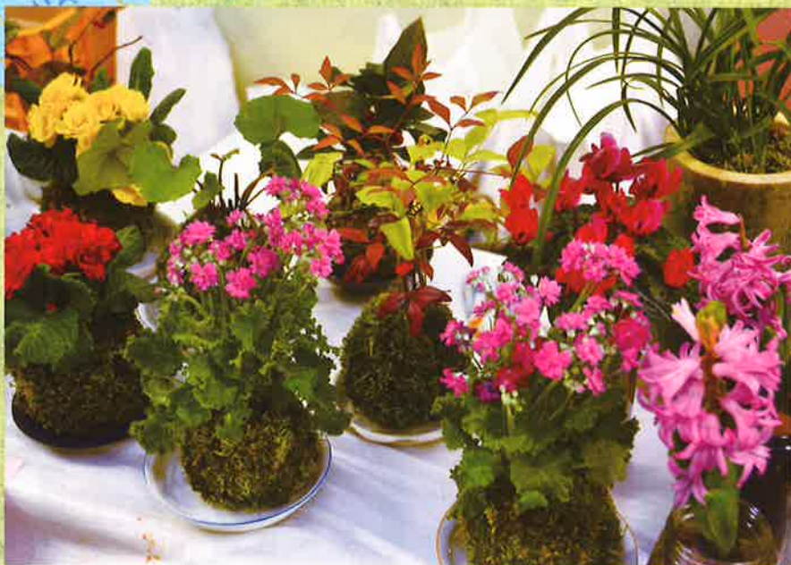
花を植えた個性的な苔玉