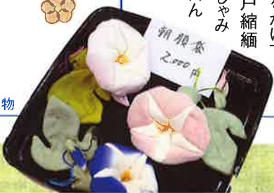
古布で作った、かわいい小物

前から来たいと思っていて、念願の初来場です。レベルの高さが想像以上で、作品に込められた思いが伝わってきます。一つひとつ、時間をかけて丁寧に作っているのでしょう。若い人では、なかなかこうはいかないような気がします。