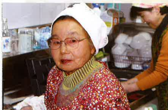
得意な料理の腕前を振るって、 おいしい昼食を皆に提供しています

「これからも元気な高齢者が高齢 者を支え、地域でつながりを持って 健康で心豊かに暮らし続けられるよ う取り組んでいきたい」と熱く語って くれました。