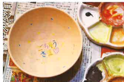
絵付け体験もできました