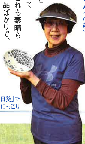
「土工房 向日葵」で買ったお皿を手に、にっこり

ヨガ仲間が出展していることもあって、初めて訪ねました。どれも素晴らしい手づくり作品ばかりです。すごい一言です。本当に来て良かったな、と思います。このお皿、細かい模様がとてもいいでしょう。主人に見せたいな、と思って購入しました。