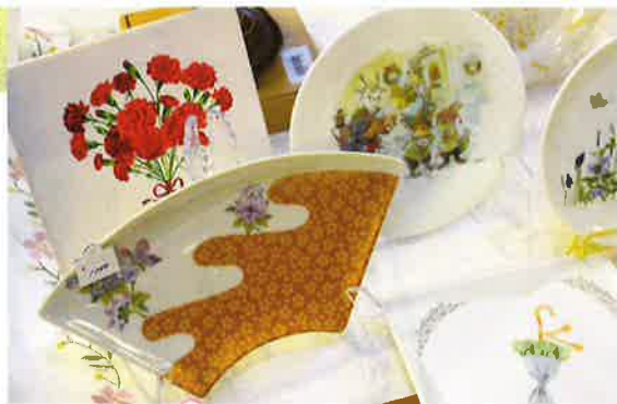
転写シールを張ったお皿