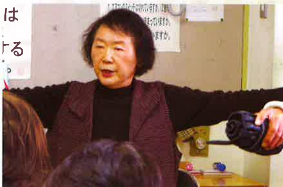
健康増進サポーターとして、元気に活動中。歌に合わせた手遊びも好評です

「地域で見かけた気がかりな高齢者への声掛けなども行い、皆で支え合いながら、江ノ口地区を元気でいきいきと明るいまちにしていきたい」と思いに溢れる言葉をいただきました。