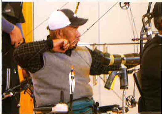
年齢は重ねられましたが、 重ねた練習による卓越した腕前は健在です