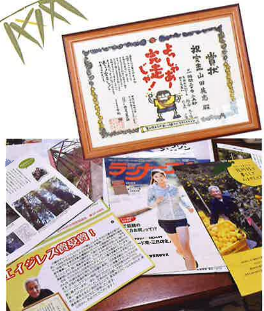
上/初めてのフルマラソンで賞を獲得した馬路村の「おらが村臓やぶりフルマラソン」 下/マラソン雑誌や村の広報紙、テレビなど、あらゆる媒体にも紹介されています

身長は153cm、体重は53kg。20年来変わらぬスタイルと筋力で今日も走ります！