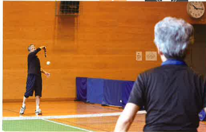
コートが小さくボールが弾むので、スピード感のあるゲームが楽しめます