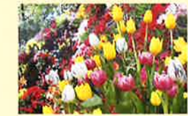
剣道会場の砺波市はチューリップの名産地!

来年のねんりんピックは和歌山県で開催されます!! 選手の活躍は8・9ページのいきいきレポートで紹介しているよ!