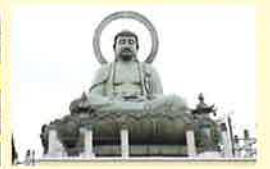
ソフトテニスなどの会場、高岡市!高岡大仏は美男で有名(へへ)

いきいきライフ推進課ホームページ「高知いきがいネット」 ( http://www.pippikochi.or.jp/ikigai/ )もチェックしてみてね。