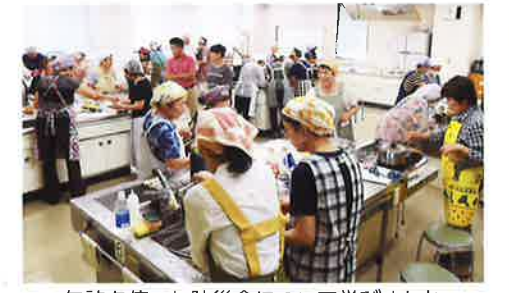
缶詰を使った防災食について学びました

また、新しい友だちとの出会いも大きな魅力の一つ。楽しい「リフレッシュ講座」を受講しませんか。