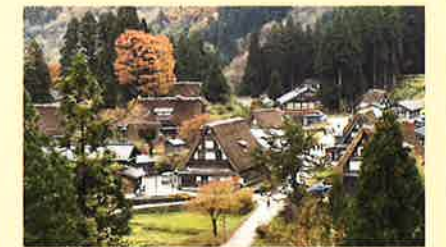
ベタンク会場で、豪雪地帯の南砺市にある「五箇山合掌造り集落」は、岐阜県の白川郷と共に世界遺産に登録。今も住居として生活文化を伝えているんだ!

開会式のお弁当も、富山のごちそうがいっぱい詰まっています!富山の代表「ます寿司」をはじめ、「富山湾の宝石」と呼ばれるシロエビ入りかき揚げや、煮溶かした寒天に溶き卵を入れて固めた「べっこう」などなど、初めて食べるものばかり(>▽<)!