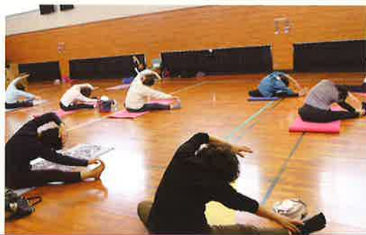
続けることで体幹が鍛えられ、冷え症や腰痛の改善、ケガの予防など期待される効果がたくさん

首や腕、肩、背中、足と身体の筋をゆっくり伸ばす動作。リンパ節もさするようマッサージにマッサージ師