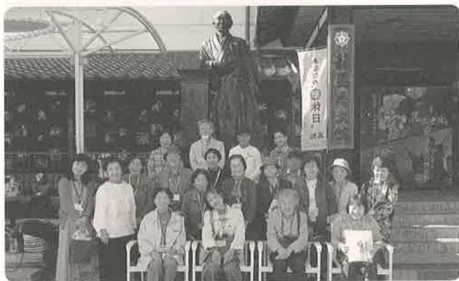
学外研修の様子(創造広場「アクトランド」にて)