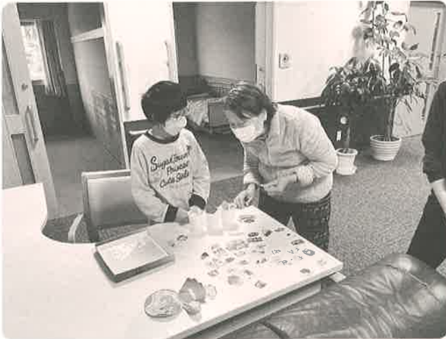
可愛い店主さん「これくださいな」

今回は1階共生型の日々の様子をご紹介します。みんな元気いっぱいコロナの収束と春の訪れが待ち遠しいです！