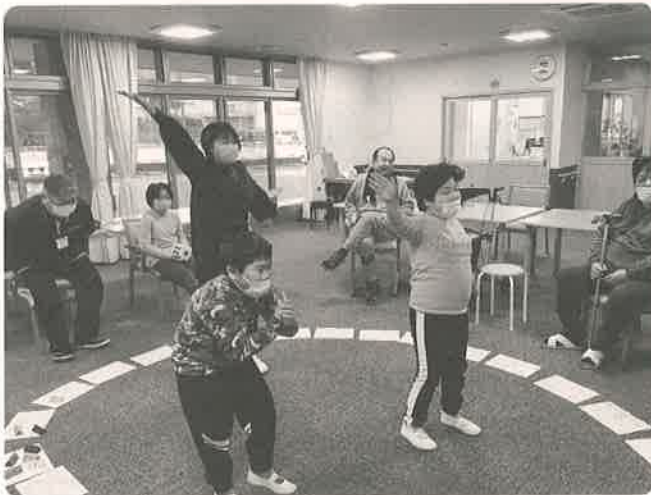
すごろくで本日5回目のDance 戸