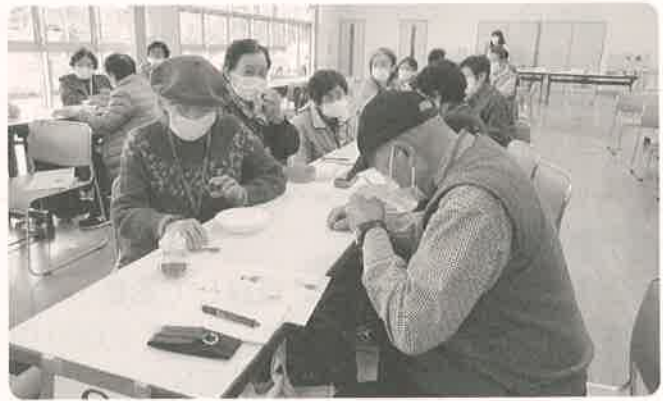
講義の様子(匂い袋作り体験)