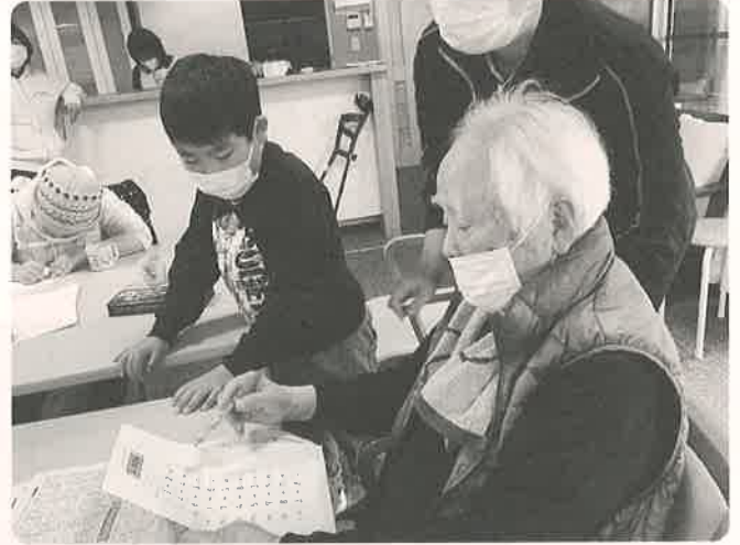
宿題を採点中～「どれどれ」