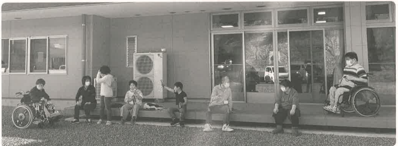
みんなで鬼ごっこの合間のひと時～ スタッフ「もう少しやすませて～」