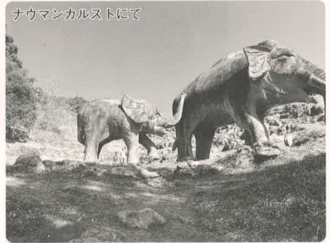
ナウマンカルストにて