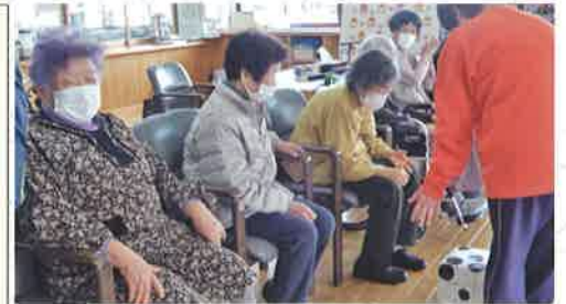
* デイサービスセンター *