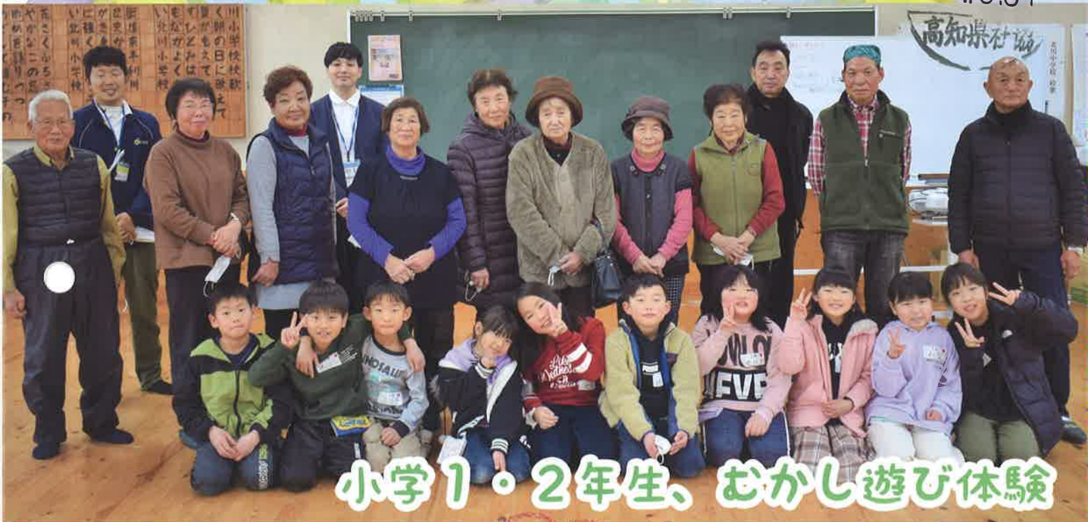
小学1・2年生、むかし遊び体験