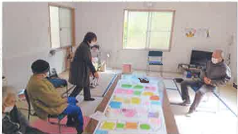
* 市のふれんど *

デイサービスとあったかの利用者さんが「人間すごろく」で遊びました。このすごろくは、小学生たちがゆずの花で作ったものです。すごろくのマスの内容を決め、サイコロも全て手作りしました。