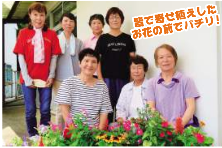
皆で寄せ植えしたお花の前でパチリ!