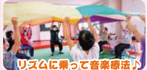
リズムに乗って音楽療法♪

津呂いきいきクラブは津呂旧保育園にて毎月開催されており、偶数月は会場周辺の花壇整備を行うガーデンサロン、奇数月はゲームや体操、講師を招いて音楽療法等皆で楽しめるサロンが行われています。6月にはボランティアが講師となり、環境浄化複合微生物の「えひめAI」作りをする等新しいことにも挑戦しています。