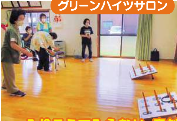
グリーンハイツサロン