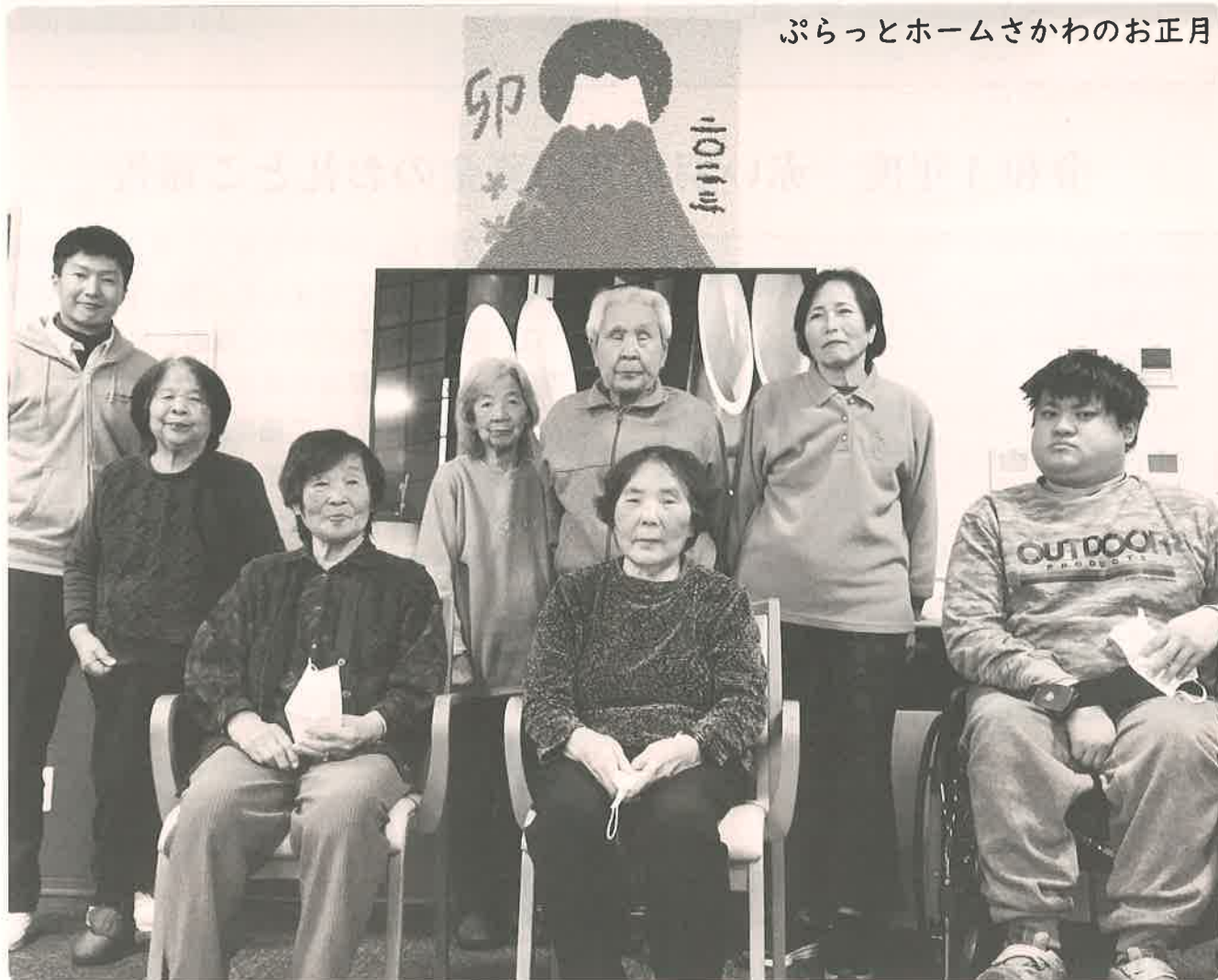
ぷらっとホームさかわのお正月