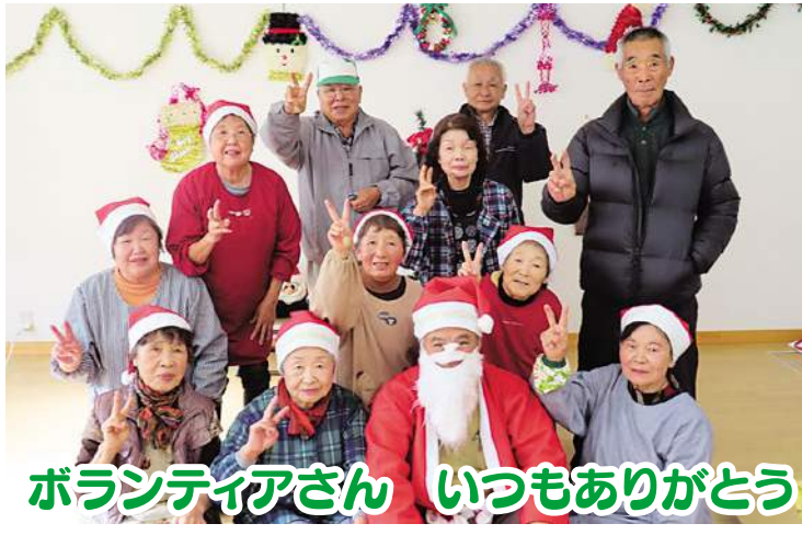
ボランティアさん いつもありがとう

布若葉会は布旧保育園にて毎月第4木曜日に開催しています。12月のサロンはバイキング方式のモーニングを行い、たくさんの方が参加されました。ボランティアがサンタとなり、みんなで楽しく過ごしました。力仕事は男性ボランティアが率先して行うなど、上手に役割分担をしてサロンを運営しています。明るくて元気なボランティアの皆さん、これからもよろしくお祈りします!!