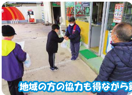
地域の方の協力も得ながら鉢花とハッピーを届けました。