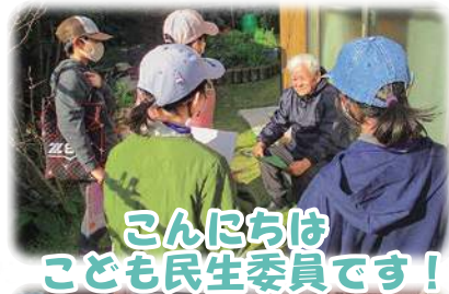
こんにちは こども民生委員です!