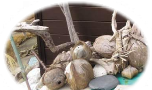
コレクションがいっぱい!

大津に生まれ、4才の頃に父親の造船の仕事の関係で戎町へ。そのまま父親の跡を継ぎ、造船所を営んでいました。戎町でご近所だった幼馴染の奥様と一緒に明糺さん。3人の子供をもうけ、現在長男さんは隣にいらっしゃるとうれしそうにお話してくれました。