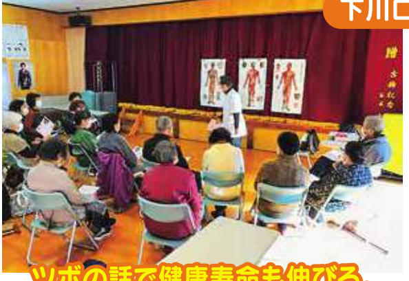
ツボの話で健康寿命も伸びる。