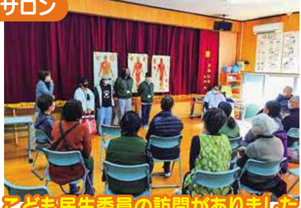
こども民生委員の訪問がありました。