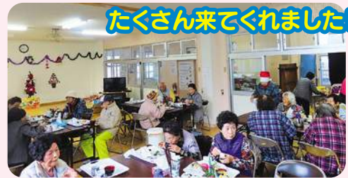
たくさん来てくれました!!