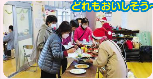
どれもおいしそう～

布若葉会は布旧保育園にて毎月第4木曜日に開催しています。12月のサロンはバイキング方式のモーニングを行い、たくさんの方が参加されました。ボランティアがサンタとなり、みんなで楽しく過ごしました。力仕事は男性ボランティアが率先して行うなど、上手に役割分担をしてサロンを運営しています。明るくて元気なボランティアの皆さん、これからもよろしくお祈りします!!