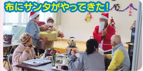
布にサンタがやってきた!