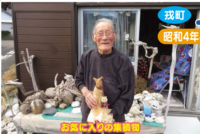
お気に入りの集積物