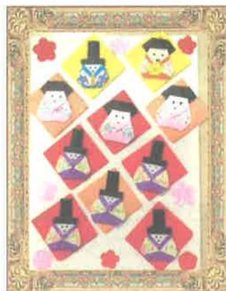
【デイサービスセンターこいのぼり】 お雛様