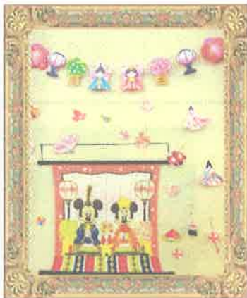
【小規模多機能ホーム香月】 ひな祭りの壁飾り