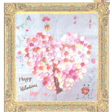
【デイサービスセンターひだまり】 バレンタイン