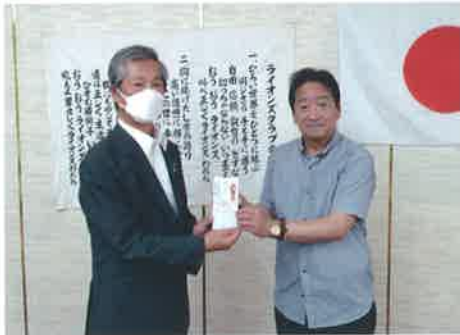
土佐ライオンズクラブ様より土佐市 の子ども食堂へ寄付を頂きました！

地域の方よりたくさんの寄付を頂きました。 頂いた品は子ども食堂や必要としている方へお届けいたします。