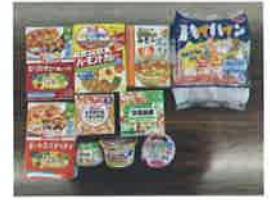
下元 葉月 様より