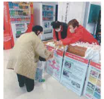
土佐市での炊き出し訓練の様子