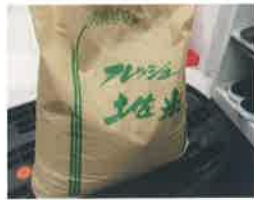
森 健 様より