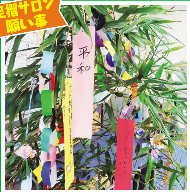
足摺サロン 願い事