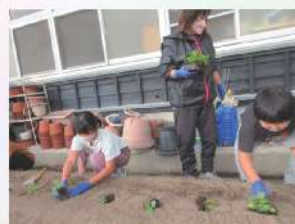
チューリップ植え