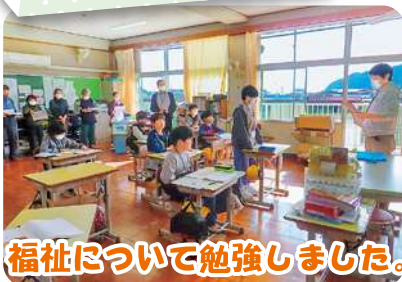
福祉について勉強しました。

三崎小学校は、子ども民生委員活動が初めての取り組みになりますが、今まで培ってきた福祉活動を中心に地域や高齢者の皆さんを元気にしていきます。