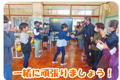
一緒に頑張らしましょう!