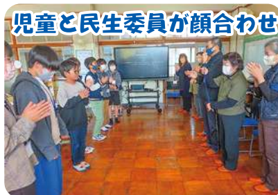
児童と民生委員が顔合わせ