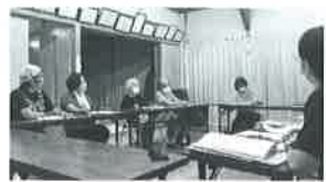
↑津久茂地区座談会の様子

地域住民が主体となって地域福祉の推進に取り組む「安芸市地域福祉計画・地域福祉活動計画」では、今年度も市内16地区で座談会を実施しています。今後の地域福祉に向けた取り組みを、みなさんと話し合っていきたいと思っております。