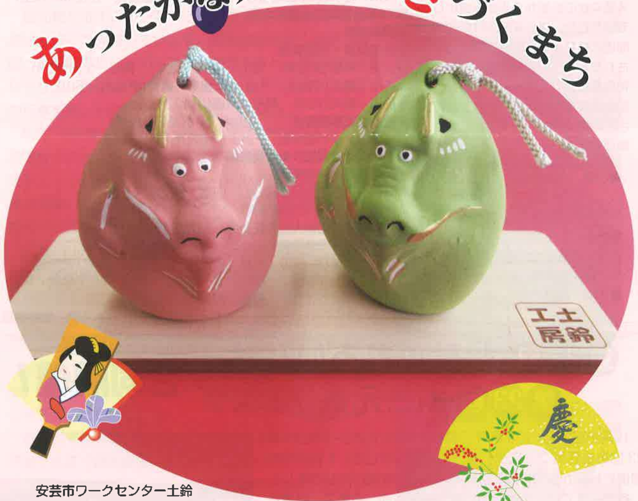
安芸市ワークセンター土鈴