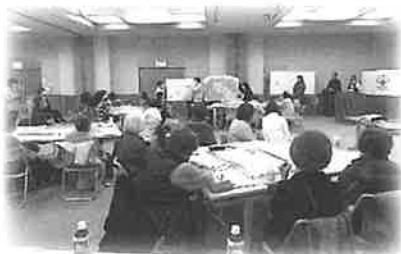
日赤高知県支部 災害図上訓練の説明

1月30日(火) すこやかセンター伊野大会議室にていの町日赤奉仕団研修会を3年ぶりに開催しました。30名の奉仕団員が集まり「災害図上訓練(DIG)～水害と大雨土砂災害に備える～」をテーマに、グループで自分達の住んでいる地域の地図を囲み、災害のイメージトレーニングを行いました。奉仕団員からは「改めて防災グッズの点検をしようと思った」「災害が起こりやすい所、支援が必要な所が分かって良かった」という感想がありました。いつか起こるであろう南海トラフ地震に備えて防災意識が高まる研修となりました。