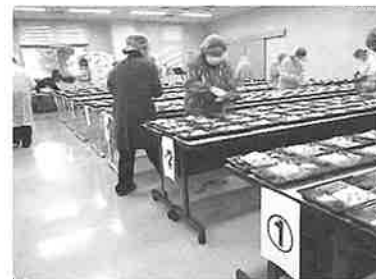
【配食事業】 588名の方にお弁当をお届けしました

この運動は、地域の誰もが安心してお正月を迎えることができるよう、共同募金運動の一環として地域住民や社会福祉関係機関・団体が協力し、地域の様々な福祉活動を実施しています。いの町では、民生委員児童委員による独居高齢者宅への訪問（愛の一声運動）や配食事業を行っております。また高齢で清掃等が難しいご家庭に、年末年始を気持ちよく過ごしてもらえよう、いの町シルバー人材センターのご協力で自宅の簡単な修繕や清掃を行いました。皆さまの温かい志に深く感謝申し上げます。