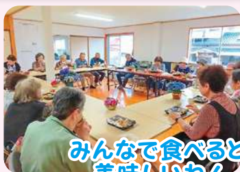
みんなで食べると 美味しいね!

コロナ禍には、みんなで一緒に食事をすることを控えていましたが、昨年から食事も再開したことで、参加者全員で過ごす時間も少しずつ増え、サロンの場にも活気があふれてきました。