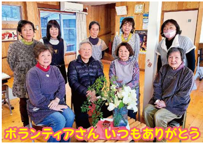
ボランティアさん いつもありがとう

窪津ツバキ会は、窪津区長場にて毎月第2木曜日に開催しています。今年で8年目を迎える9名のボランティアさんは、サロン参加を通じて仲の良さ・チームワークと信頼関係を築いてきました。2班に分かれ、月交代で食事の準備を行うなど、上手に役割分担してサロンを運営しています。毎回、食事のテーブルには季節の花を飾り、参加者の楽しみの一つになっています。この日も参加者が花をもらって「帰って自宅に花を飾るのが楽しみ!」と笑顔で話してくれました。