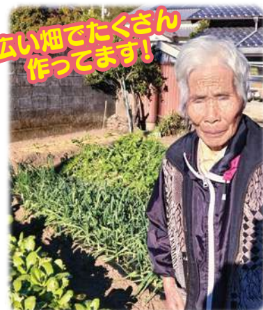
広い畑でたくさん 作ってます!

畑で野菜を育てることと、サロンで顔なじみの人に出たりするのが何よりの楽しみだそうです。これからも末永くお元気でいて下さいね。