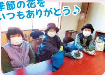
季節の花を いつもありがとう♪

窪津ツバキ会は、窪津区長場にて毎月第2木曜日に開催しています。今年で8年目を迎える9名のボランティアさんは、サロン参加を通じて仲の良さ・チームワークと信頼関係を築いてきました。2班に分かれ、月交代で食事の準備を行うなど、上手に役割分担してサロンを運営しています。毎回、食事のテーブルには季節の花を飾り、参加者の楽しみの一つになっています。この日も参加者が花をもらって「帰って自宅に花を飾るのが楽しみ!」と笑顔で話してくれました。