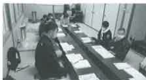
↑黒鳥地区座談会の様子

つきましては、令和6年度第1回目の座談会を下記のとおり各地区で開催します。是非たくさんの地域の方に参加いただき、それぞれの取り組みや困りごとなど、いろいろな声をお聞かせください。