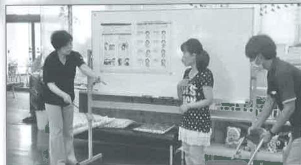
成ちゃんの手話講座