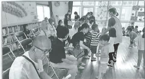
甲浦保育園へお邪魔しました