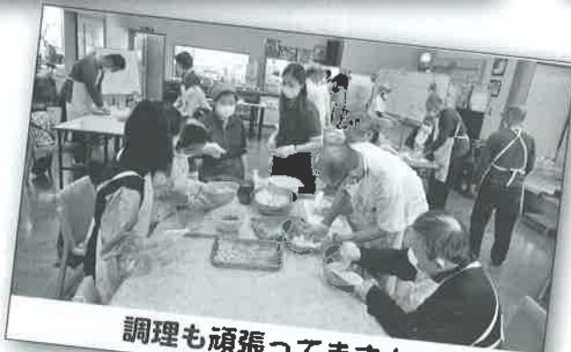
調理も頑張ってますよ～