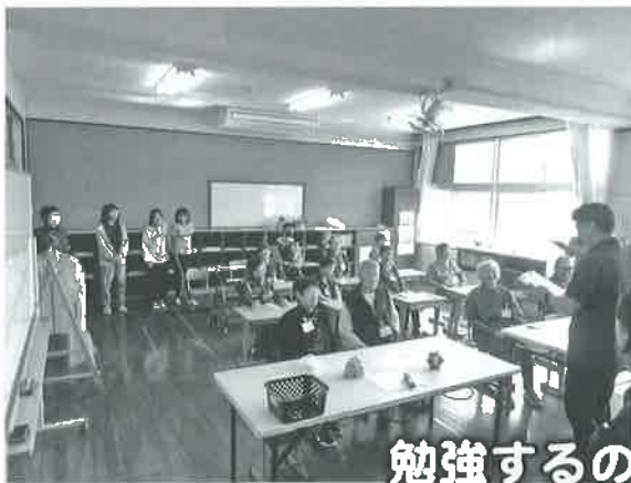
勉強するのは何年ぶり？