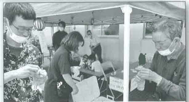
室戸フェスにも参加