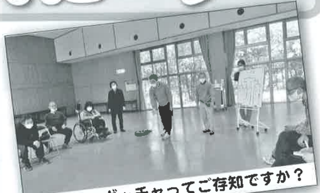
皆さん、ポッチャってご存知ですか？