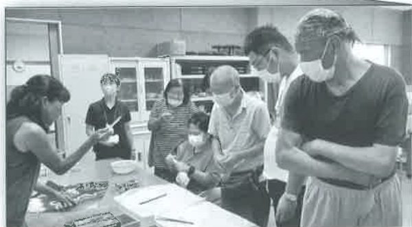
海陽町文化村での藍染体験