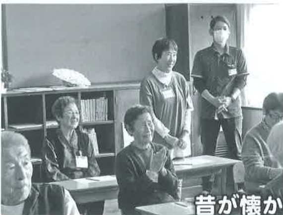
昔が懐かしいねえ～