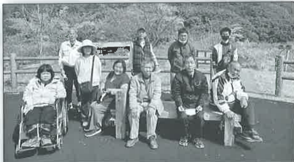
お花見に行ってきました