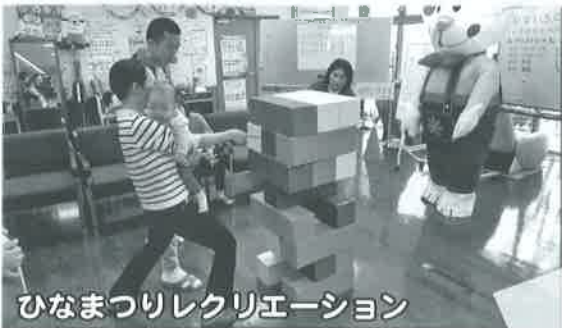
ひなまつりレクリエーション