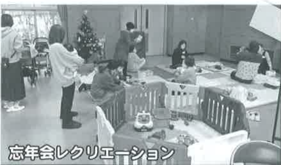
忘年会レクリエーション

また、ママさんの中には「なないろ広場」以外の日にも子どもさんを連れて来てくれる方もいらっしゃって、高齢者等との交流もされています。世代間交流ともなりますので、お気軽にお越しください。