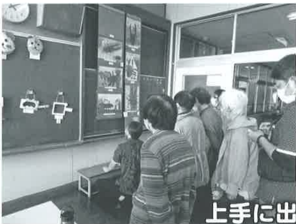
上手に出来ちゅう！

また、この日は高齢者の授業を小学生が様子を見に来てくれて、いつもと違う参観日となりました。